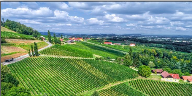
EDELBACH 420m | Südost Hanglage | Schluffiger Lehm mit Kies Grobanteil