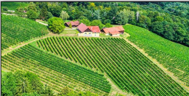
STIELHANG 400m | Ost Steillage | Lehmboden stauend über Tertiärmaterial