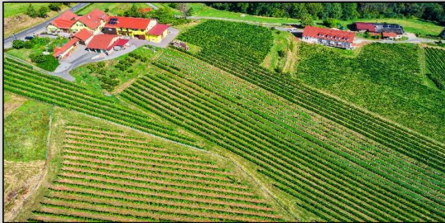
ECKBERG 420m | Osthang | tertiärer Kalkmergel- Lehm Boden