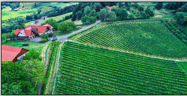
URLKOGEL 480m | Südwest Kessellage | lehmiger Sand mit Schotteranteil